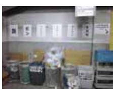
ごみ保管場所の配置