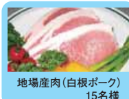
地場産肉(白根ボーク) 15名様