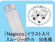
「Negicco」イラスト入りスモーザーボトル 50名様