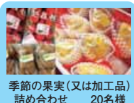
季節の果実(又は加工品)詰め合わせ 20名様