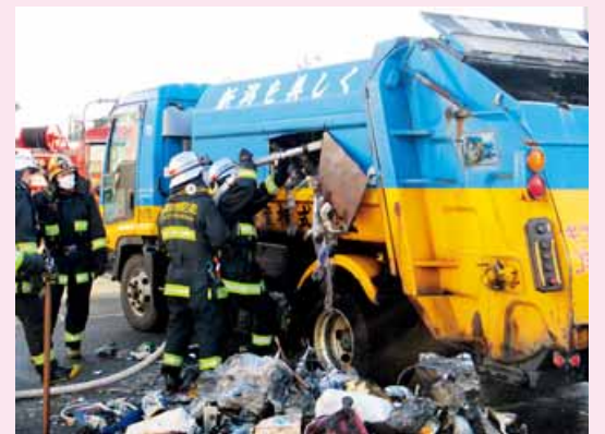
火災が発生したごみ収集車の消火活動