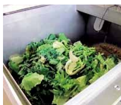
生ごみ処理機で堆肥化している様子