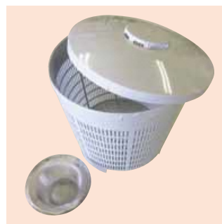
生ごみカラット(イメージ)

生ごみ風乾容器「生ごみカラット」を使った市民対象の講座を下記のとおり開催します。また、講座参加者のうち希望者には「生ごみカラット」を進呈します。