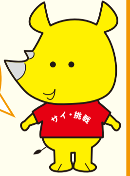
新潟市ごみ減量推進キャラクター「サイチョ」