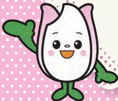
新潟市食育・花育推進キャラクター まいかちゃん

食品ロス削減のため まだ食べられるのに捨てられてしまう 食品を使ったレシピを大募集！