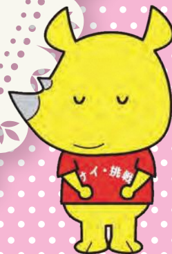
新潟市ごみ減量推進キャラクター サイチョ