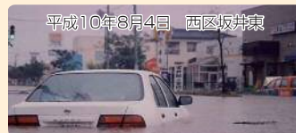
平成10年8月4日 西区坂井東

新潟市では床上浸水など被害の大きかった地域について 10 年 に一度の確率で降る雨の強さ（概ね 1 時間当たり約 50 ミリ）を もとに下水道施設の整備を進めています。