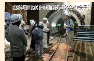
坂井雨水1号幹線(見学会の様子)