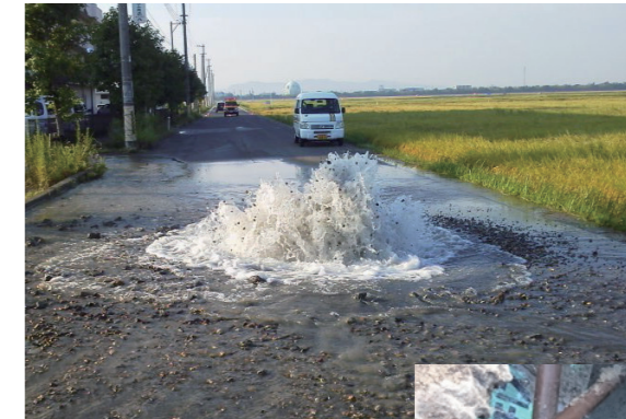
◀水道管の漏水状況

更新・耐震化にかかるお金が少なくなると、老朽化にともなう事故や、地震などの災害時に断水が生じるなど、 水道水を安定してお届けできなくなります。