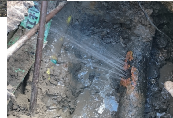
▲漏水している古い水道管