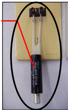
フィーダー端子の場合

また、ケーブルテレビ(CATV)で受信している住宅についても同様の対応で視聴が可能となりますが、テレビの型式等によりCATV専用チューナーが別途必要になることがありますのでご不明な点は、NCVニューメディア新潟センター(025 280 1200)までお問合せください。