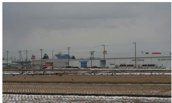
147. 秋葉区程島付近 12月29日14:45 新津市街地に近い水田で採餌する群