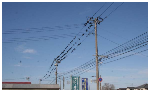
153. 江南区亀田大月 12月19日13:50 市街地の電線に止まる小群. 近くに食品工場.