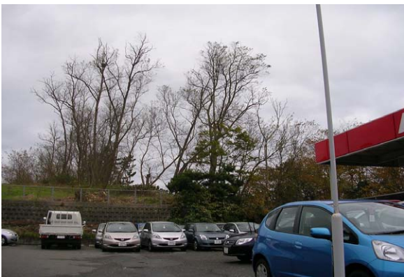
124. 東区新潟空港近く 11月23日撮影