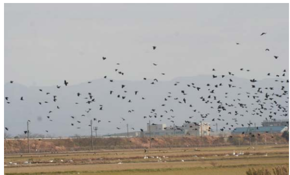
139. 磐越道新潟PA付近 12月5日12:50 関屋地区を塙とするミヤマガラスは市民病院付近を通り鍋湯新田や新潟PA付近の水田に展開する