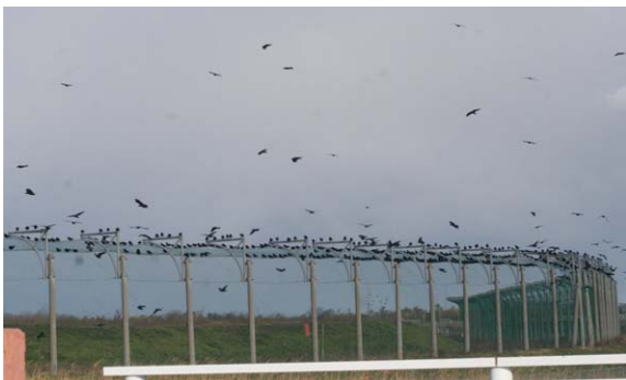
150. 西区早瀬付近 1月2日9:50 水田と電線や木立がセットになったような場所がよくみられる。写真は処分場のフェンス