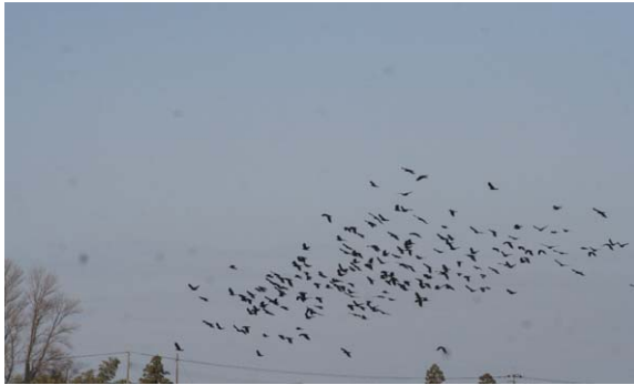
144. 秋葉区大秋 12月19日9:20 この写真から183羽が数えられる