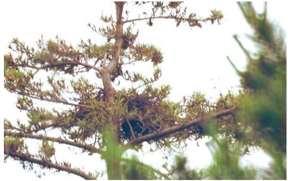
121. 西蒲区越前浜NK-34 6月28日 マツ