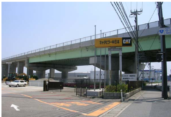
134. 西区山田 6月12日 高速道路橋脚に営巣