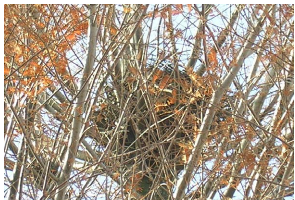
127. 中央区日の出公園 メタセコイヤに営巣