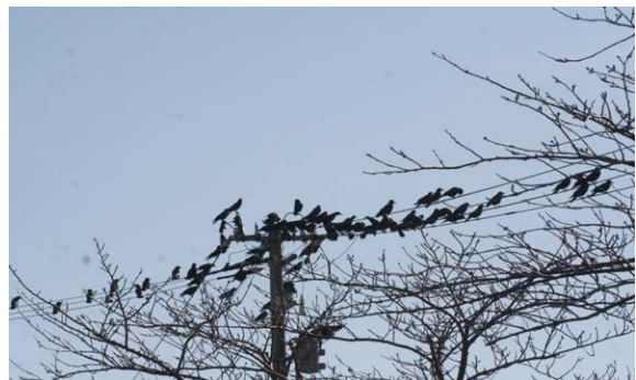
151. 江南区大淵付近 12月19日12:10 用水路沿いの桜並木と電線に集まっている