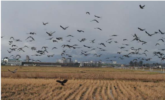
136. 西区新通IC付近 1月3日10:00 新大を塙とするミヤマガラスはまずこの辺りの水田に飛来する