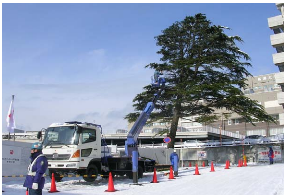
132. 中央区旧平安閣 11月14日剪定作業の際に撮影