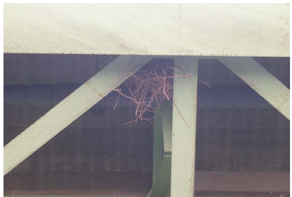
135. 西区山田 高速道路橋脚にかけられた巣