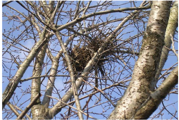
129. 北区新井郷川浄化センター サクラに営巣