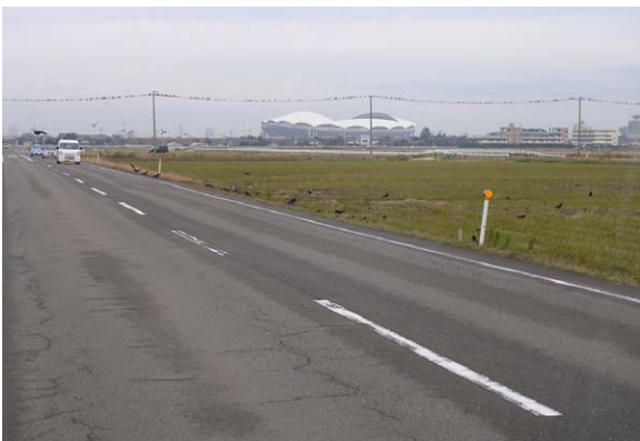
138. 鍋湯新田付近 11月22日11:10