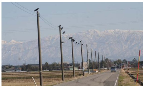
152. 江南区藤山付近 12月19日11:55