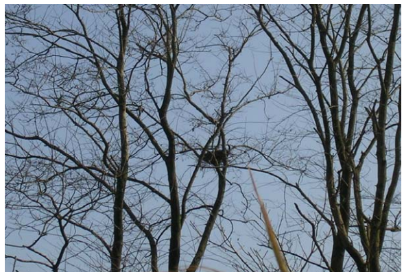
131. 北区新井郷川浄化センター 130. の巣の状況