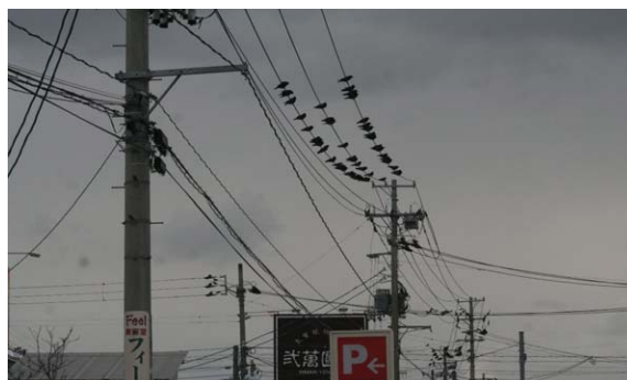
157. 秋葉区程島 12月29日14:30 秋葉区役所に近い市街地の電線に集まる