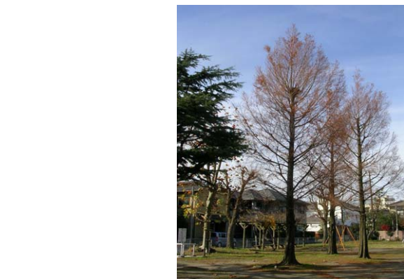
126. 中央区日の出公園 12月2日撮影