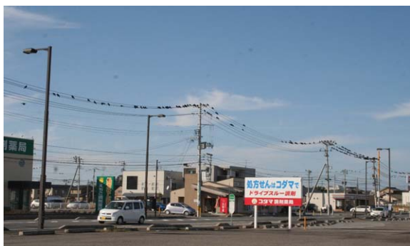
156. 西区新通付近 12月19日13:00 午後になると新大の畔に近い住宅地の電線などに集まってくる