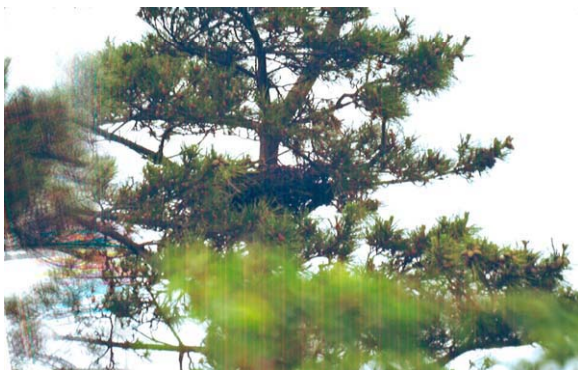
122. 西蒲区越前浜NK-35 6月28日 マツ