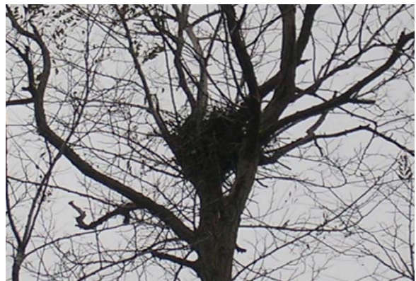
125. 東区新潟空港近く 124. の巣の状況