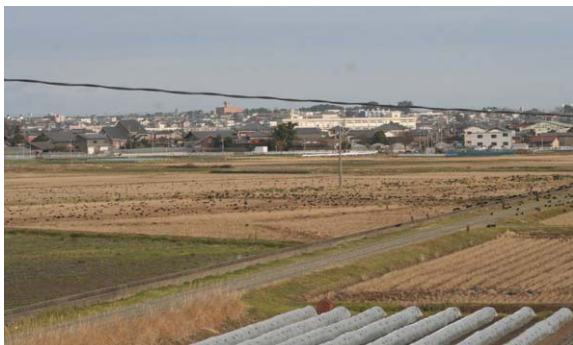
142. 西区亀貝IC付近 12月30日9:45 亀貝IC～曾和IC付近の水田地帯は新大を塙とするガラスがまず飛来する