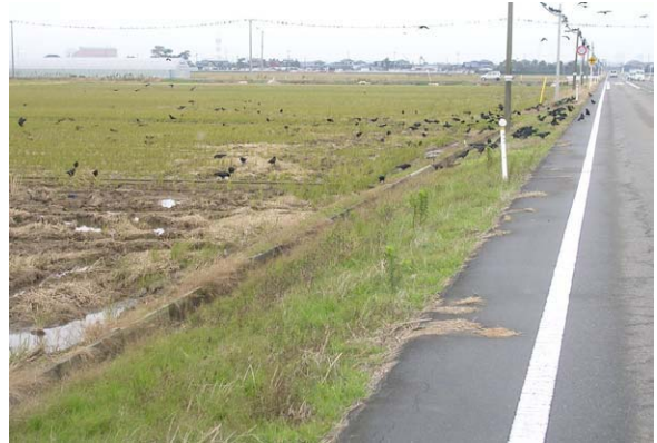
137. 鍋湯新田付近 11月22日11:10