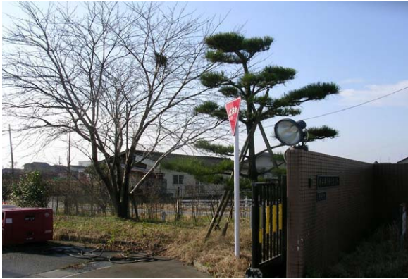
128. 北区新井郷川浄化センター 12月20日撮影