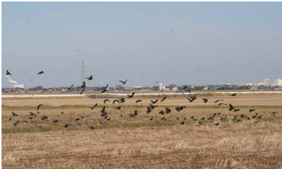
140. 磐越道新潟PA付近 12月19日11:10 新潟PA～曾野木団地付近の水田ではミヤマガラスの群がよく観察される