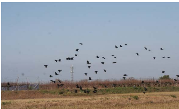
146. 秋葉区覚路津 信濃川堤外地 12月19日9:40 信濃川沿いの果樹園地帯でみられた小群