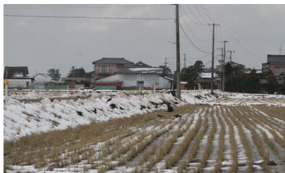
159. 北区岡新田付近 12月29日12:35 積雪があると、地肌をみせる土手の叢に集まって採餌する