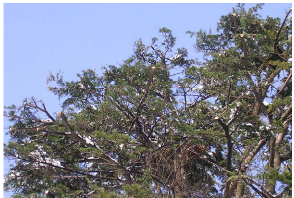
133. 中央区旧平安閣 ヒマラヤスギに営巣