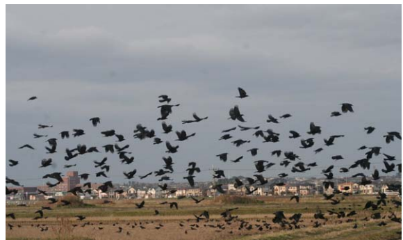
143. 西区新通IC付近 12月30日9:10