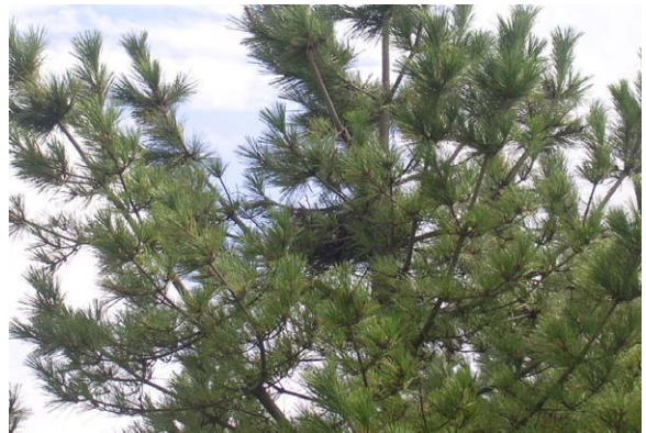
123. 中央区美咲町 9月13日撮影 マツ