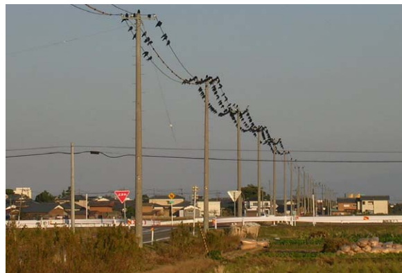
149. 鍋湯新田付近 11月20日15:40