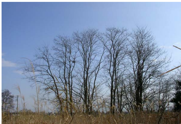
130. 北区新井郷川浄化センター 12月20日撮影