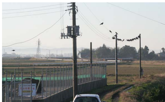
155. 南区白根斎場付近 12月19日8:20 廃棄物処分場にはいつも20~30羽が集まっている