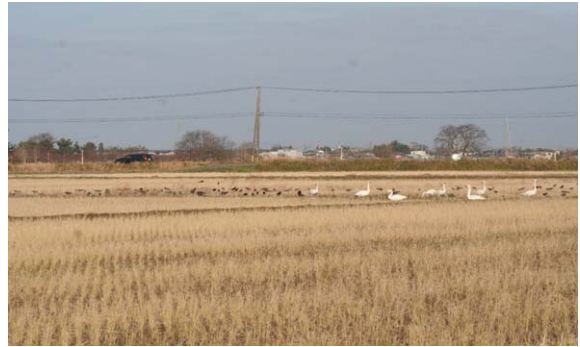
145. 秋葉区覚路津 12月19日9:30 ハクチョウの群の隣で採餌するミヤマガラス