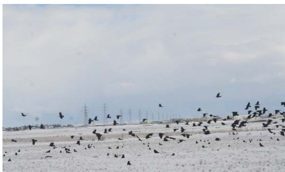
158. 西区みずき野付近 1月10日12:05 積雪の日、500羽以上の群れが雪原を這うように移動する