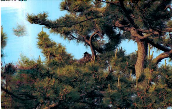
120. 西蒲区越前浜NK-33 6月28日 マツ