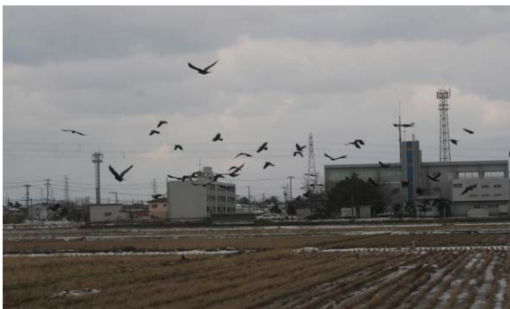
148. 北区木伏付近 12月29日10:40 北風の強い日、風を避けるように住宅地の南側に隣接する水田でみられた小群