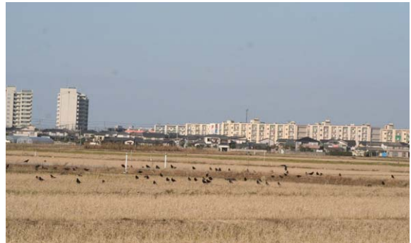
141. 曾野木団地付近 12月19日10:45