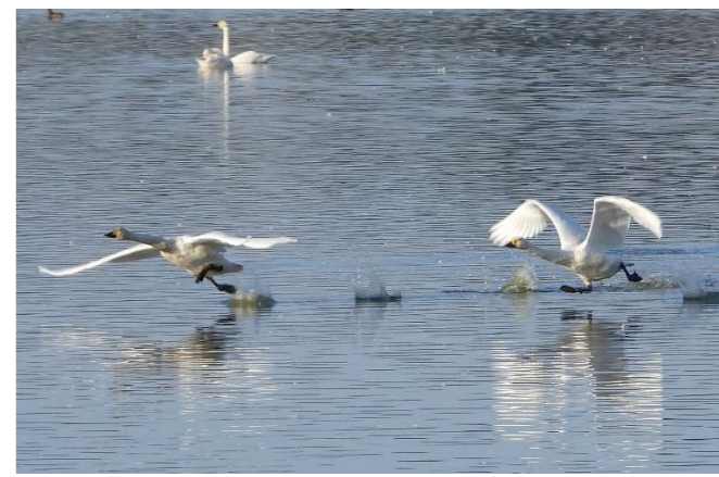
コハクチョウ(朝6時ころから順次飛び立ちます)

毎年秋になると、冬鳥が飛来し、佐潟がにぎやかになります。2019年度はコハクチョウを10月6日に初確認しました。今回は、秋から早春にかけて佐潟で見られる野鳥の一部を紹介します。休日は、早朝の佐潟で野鳥を観察しませんか！