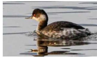
ハジロカイツブリ