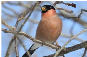
ウソ(亜種アカウソ)