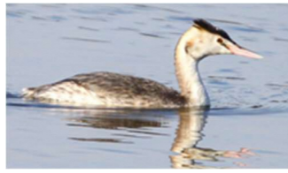
カンムリカイツブリ