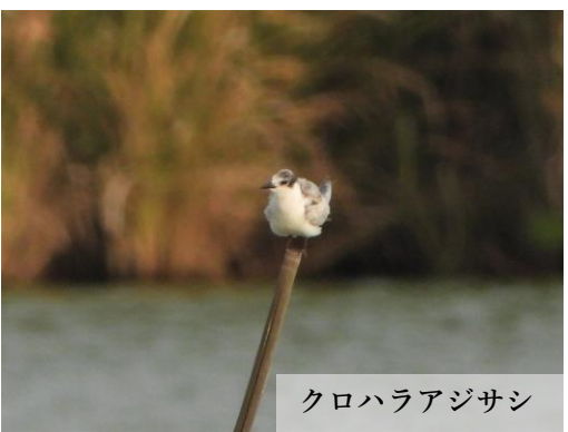
クロハラアジサシ