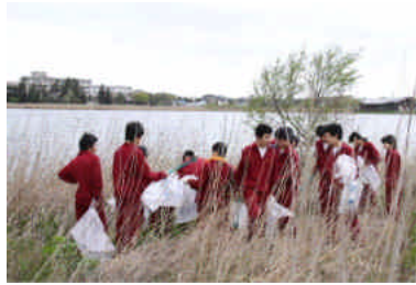
芝生広場もごみ0に

4月23日、佐潟のほとりにあります赤塚中学校の主催で「佐潟クリーン活動」が実施されました。当日は市内のNGO団体や地域の方々も協力参加し、総勢200人で行われました。学年ごとに分担して佐潟周辺に捨てられているごみ収集と県道沿いの花壇の手入れをしました。この活動は「地域に根ざした活動」の推進から同校が毎年行っており、佐潟の保全に大きく貢献しています。