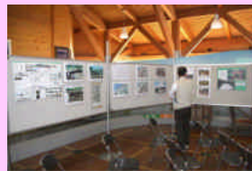
赤塚と中原邸の歴史展