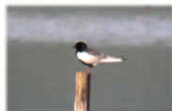
ハジロクロハラアジサシ

久しぶりにハジロクロハラアジサシが立ち寄りしました。ヒシの葉が湖面にたくさん出ています。今年も繁茂しそうです。