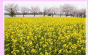
桜並木の脇の菜の花畑