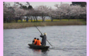
のんびり「潟舟」は大忙し