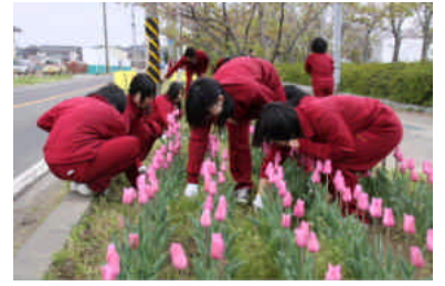
チューリップの花壇も