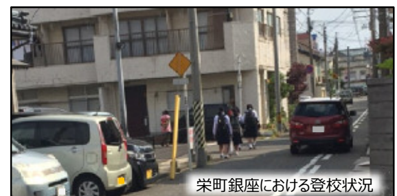
栄町銀座における登校状況