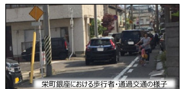
栄町銀座における歩行者・通過交通の様子

新潟市では、公道で日本初となるライジングボラードを古町モール6で平成26年8月から運用。古町通8番町で平成28年3月の運用に続き、栄町銀座で本市3か所目となります。