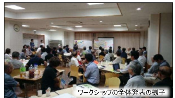
ワークショップの全体発表の様子