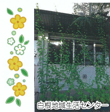
白根地域生活センター