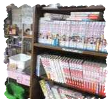
◀絵本だけでなく、大人が楽しむ漫画や雑誌コーナーも！