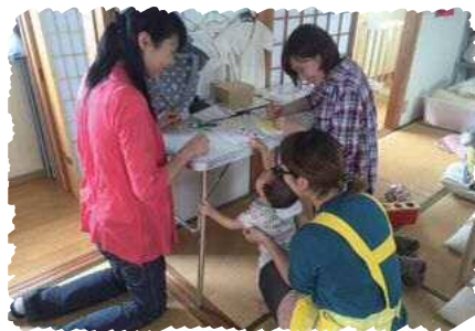
▲スタッフが側で子どもを見守ってくれて、こんなに夢中になったの久しぶり！楽しい！