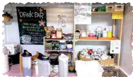
▲セルフサービスのドリンクバーでゆっくりTea Time。