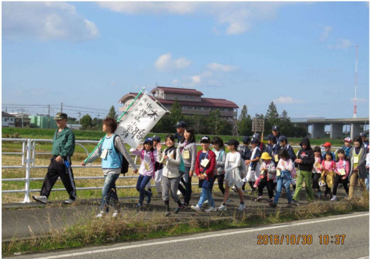
リーダーに先導され、みんな仲良く行進です