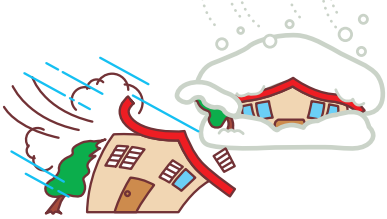
台風や大雪による被害