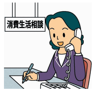
消費者庁イラスト集より

※寄せられた相談情報は個人を特定できる情報を除いてデータ化され、統計処理を行ったうえで、消費者への注意喚起や法改正の基礎資料に使われるなど、消費者被害の未然防止・拡大防止に大きな役割を果たしています。