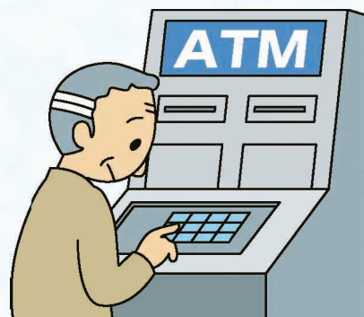
消費者庁イラスト集より

以前は、「オレオレ詐欺」などの5種類の手口を「振り込め詐欺」と言っていましたが、犯行形態の多様化により、現在は「特殊詐欺」と名称を変更し、手口も10種類に増えています。