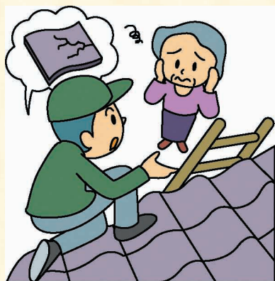
消費者庁イラスト集より