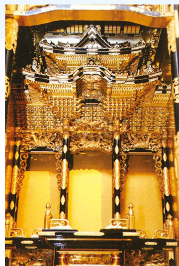
300年の技術の結晶、宮殿（くうでん）

■問い合わせ／ 白根仏壇協同組合（白根商工会内） TEL 025-373-4181