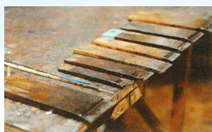
漆塗りに使う道具の数々