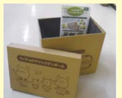
段ボールコンポスト