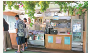
自社で加工しているジェラート