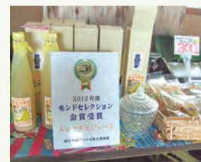
ル レクチエの加工品

また、同園はル レクチエの生産量も県内随一を誇ります。果樹園で育ったル レクチエのワインやジュース、シャーベット、ソフトクリームなどの加工品を年間を通じて販売しています。