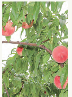
9月中旬まで楽しめるモモ