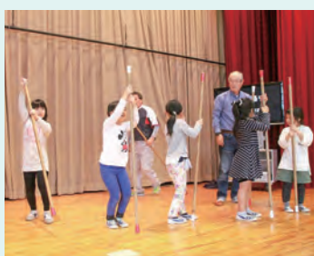
昨年の参観の様子(臼井小)

南区では今年度、小学校3校で区民の皆さんを対象に開催します。詳細は各学校にお問い合わせください。