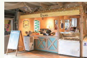
ジェラートカフェ「コンタン」

園内で採れた旬の果物などを使った特製ジェラートが大好評。全天候型のブドウ棚の下のスペースや厨房などはレンタルが可能。開放感のあるイベントや各種打ち合わせなどの利用もできます。