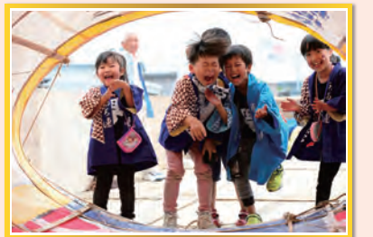
グランプリ受賞作品「ちびっ子鯛町組」

入選作品は、しろね大風と歴史の館などに展示するほか、南区観光協会ホームページにも掲載します。