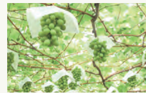
シャインマスカット

ブドウ、ナシのもぎ取り、食べ放題が11月中旬まで楽しめます。1カ所に畑がまとまっているので、園内での移動がスムーズです。ブドウは、予約すると午後9時までもぎ取りができます。目の行き届く管理を行っており、化学肥料を一切使わずに有機肥料だけで大切に育てています。