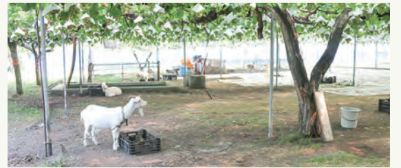
ブドウ棚ではヤギがお出迎え

1年中フルーツのもぎ取りが楽しめ、9月からはブドウ、イチジク、ナシのもぎ取りができます。広い園内では、たくさんの種類の果樹を見て自然を身近に感じられます。ヤギやウサギ、モルモットなどの小動物も飼育しており、動物との触れ合いも可能。園内で採れた果物を使ったジェラートや加工品も販売しています。