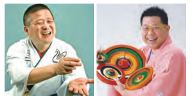
三遊亭白鳥 落語 三増紋之助 独楽回し

日時 9月23日(月・祝)午後2時~4時 場所 重要文化財 旧笹川家住宅 料金 高校生以上 500円 中学生以下 無料 定員 先着100人 申し込み不要 直接会場へ 問い合わせ 地域総務課 ☎372-6604