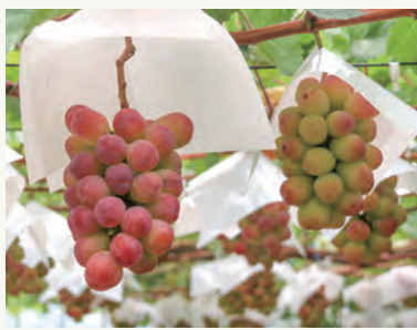
バイオレットキング