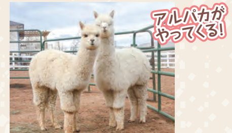
動物取扱許可番号 新潟県長保第 1205014号 動物取扱責任者 志田麻里奈