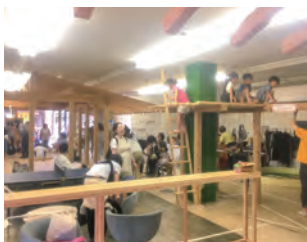
アスレチック遊具のある園内