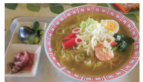
ランチメニューのラーメン