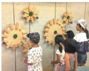
さまざまな遊び方のできる遊具