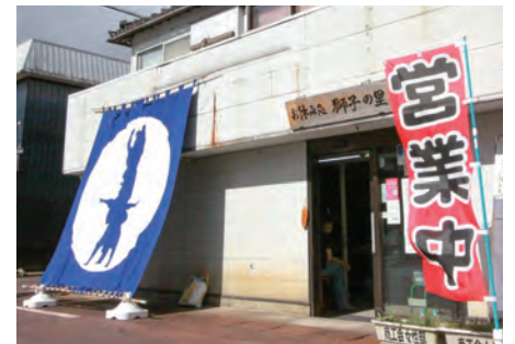
角兵衛獅子の大的れんが目印