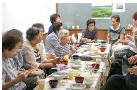
みんなで食べるとおいしい