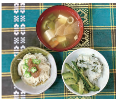
バラエティに富んだ昼食