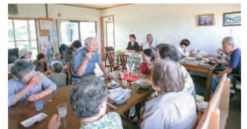
昼食時は満席の店内