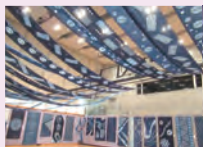
出品・展示部門(しろね絞り)