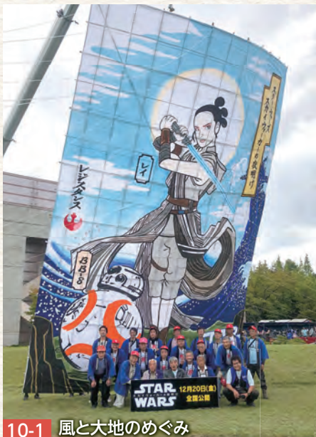
10-1 風と大地のめぐみ