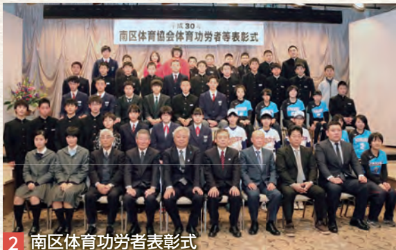
2 南区体育功労者表彰式