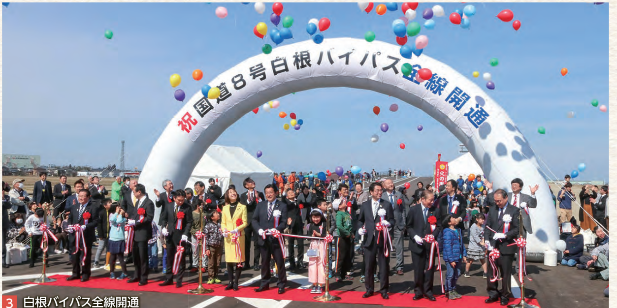
3 白根バイパス全線開通