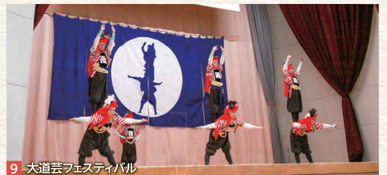
9 大道芸フェスティバル