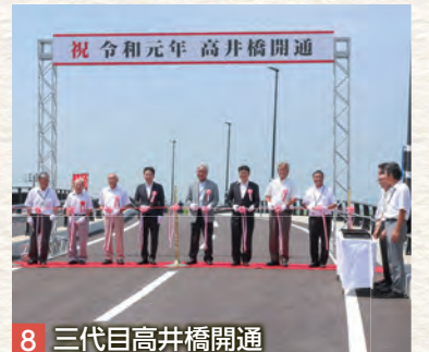
8 三代目高井橋開通