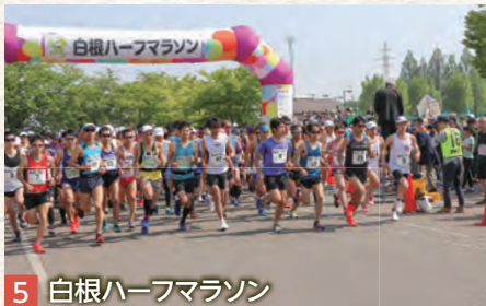
5 白根ハーフマラソン