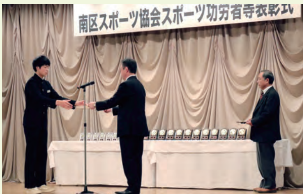
南区スポーツ協会スポーツ有功者等表彰式