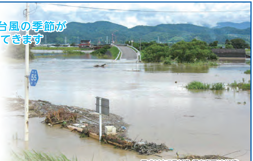
平成23年7月新潟・福島豪雨(庄瀬橋)