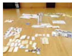
懐かしい品々が多数現れました

2000年に大通小学校の児童が同小グラウンドに埋めたタイムカプセルを20年後の2020年9月21日に掘り出しました。タイムカプセル収納品の引き渡しを下記の日程で行います。心当たりのある人はお越しください。 回 令和3年12月25日(土)まで平日9:00～17:00、日曜日9:00～13:00 場 大通地域生活センター ※10月18日(日)の大通秋まつりでタイムカプセルを展示します