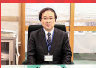
新潟市南区长 五十嵐 雅樹