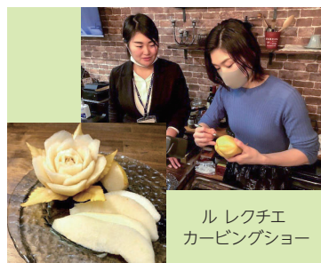
ルレクチエカービングショー