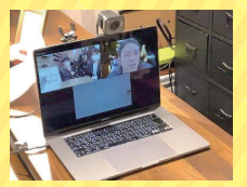
オンラインツアーイメージ

新型コロナウイルスの影響で他県との往来がしづらい状況ですが、オンラインツアーを通じての交流やPRができることを実感しています。皆さんが誇る、南区の魅力をオンラインツアーで発信しませんか!?アイデア募集中です!