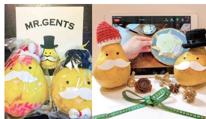
ルレクチエ飾り付け体験