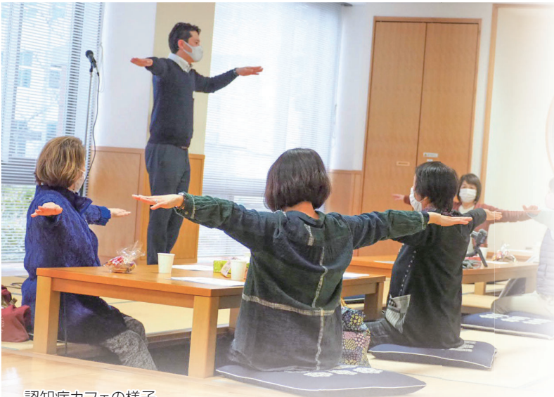
認知症カフェの様子