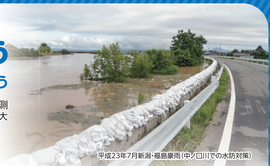
平成23年7月新潟・福島豪雨(中ノ口川での水防対策)