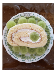
「自分でアレンジ」 muheizhenmeiさん