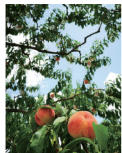
「茨曾根の桃畑で」 gata.gata40さん