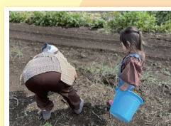
「92歳のひひいおばあちゃん」 mama__roomさん