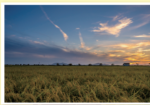
「農(みのり)の丘」 drkshdw4stringsさん