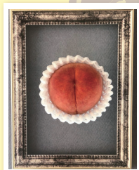
「しろねの美しい桃」 m.k.j16さん