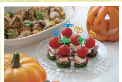
「熟成生ハム×クリームチーズ」 green_peas_さん