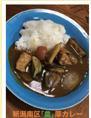
「地元産の食材で」 d.ika_20さん