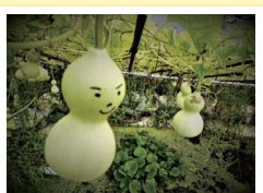
「ひょうたん人形ゆーらゆら」 itchokuさん