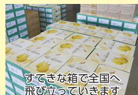
すてきな箱で全国へ飛び立っていきます