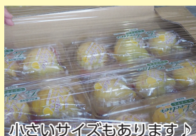
小さいサイズもあります♪