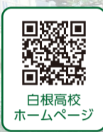
白根高校 ホームページ

令和4年に「南区」、令和5年には「にいがた南区創生会議」と連携・協力に関する協定を締結している白根高校は、積極的に地域に出てさまざまな活動を両者と協働して取り組んでいます。社会貢献につながるこれらの活動は、白根高校の特色の一つでもあります。皆さんの地域で活動をしている白根高校生を見かけたら、温かい一声を掛けてください。今回は生徒たちのたくさんの活動の中からほんの一部を紹介します。