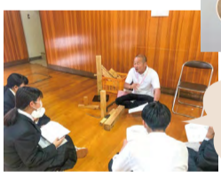
ゲストトークの様子

2年生になると「仕事人の図鑑」制作が始まります。地域(南区)を支え、地域で活躍している人に焦点をあて、生徒自らが興味を持った相手にインタビューをし、編集・デザインまでを手掛け、完成させます。今年度はにいがた南区創生会議の皆さんに協力してもらい、制作に向け「ゲストトーク」を開催しました。いろいろな職種の話の話を聞き、自身の将来を考える良い機会になりました。