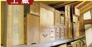
たくさんの文書箱の中には古い文献が入っています