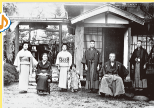
【大正元年撮影】 齋藤家当主(座位の男性)と家族

「齋藤家住宅離れ」が現在もそのたたずまいをそのまま残していることが分かる写真です。写真は、歴史の証拠として残っていきます。