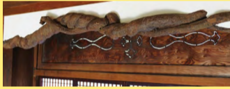
「フジ」の落とし掛け