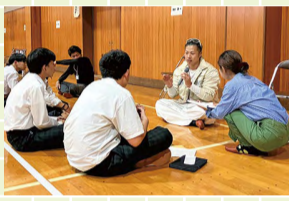
「探究の時間」ゲストトークの様子

1年生「探究の時間」では、コミュニケーション能力の向上を目指し「南区で活躍する輝く大人」16人をゲストに迎え「区の魅力」「理想の高校生活」をテーマにインタビューを実施しました。個性あふれるゲストの皆さんから、さまざまな活躍の様子を聞き、多くのことを学びました。生徒たちの心に残る貴重なお話をいただき、ありがとうございました。