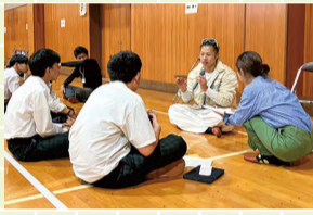
「探究の時間」ゲストトークの様子

1年生「探究の時間」では、コミュニケーション能力の向上を目指し「南区で活躍する輝く大人」16人をゲストに迎え「区の魅力」「理想の高校生活」をテーマにインタビューを実施しました。個性あふれるゲストの皆さんから、さまざまな活躍の様子を聞き、多くのことを学びました。生徒たちの心に残る貴重なお話をいただき、ありがとうございました。