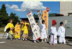
白井地区まつり 狸の婿入り行列の様子

10月17日から「しろみな塾(提案編)」が始まりました。「しろみな塾」は白高生が地域課題解決のアイデアを考える白根地区公民館主催の事業で、今年の対象地区は白井地区です。「白井地区まつり」に参加した経験を基に、地域の要望に沿ったアイデアを出せるよう、10月から3カ月かけて研修を重ねます。考えたアイデアは来年1月に白根学習館で発表します。ご期待ください。