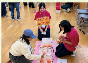
大通秋まつりの様子

秋の全校ボランティアは、9月の「校内ボランティア(流し台掃除)」に始まり「しろね大風と歴史の館開館30周年記念事業大風揚げ」「美南区クリーンアップ月間」「白井地区まつり 狸の婿入り行列」「学習館まつり」「大通秋まつり」と続きました。10月26日の翠嵐祭(文化祭)を前に校内美化にも力が入りました。そして、校外の活動では地域の人と一緒に活動することで交流を深めることができました。