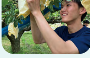
ルレクチエの袋掛け作業をしました。