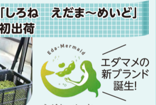
エダマメの新ブランド誕生!