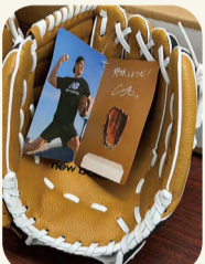
大谷翔平選手から寄贈されたグローブ