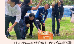
サッカーの話をしながら収穫