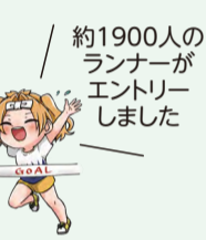
約1900人のランナーがエントリーしました