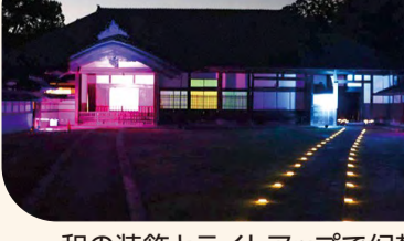
和の装飾とライトアップで幻想的な雰囲気に♪