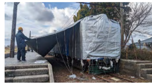
例年の冬囲いの様子

実は!今年度中に車両の補修・修繕工事が予定されているため、今のところこの冬囲いはしていません。工事が始まるまで、シートに覆われていない「雪景色のかぼちゃ電車」が今季限りの姿として、見ることができませんよ。