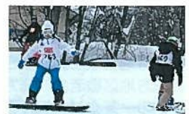
▲大分うまくなったよ