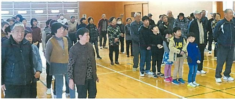
▲味方地区老人クラブの皆さんと児童・保護者約80人が西白根・味方・七穂の3チームに分かれ玉入れなどの競技や応援で一緒に汗を流しました。

綱引きの様子。写真は七穂と西白根の連合チーム。▶ 思わず応援に出る老人クラブの参加者。