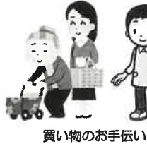
買い物のお手伝い