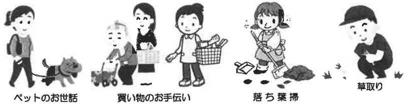
ペットのお世話 買い物のお手伝い 落ち葉掃 草取り