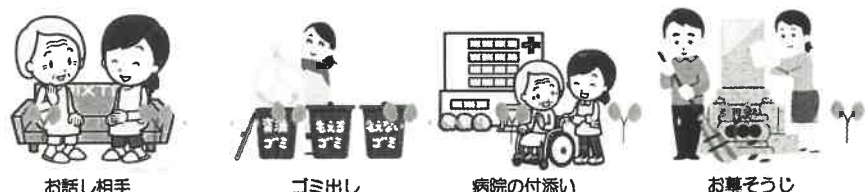
お話し相手 ゴミ出し 病院の付添い お墓そうじ

【現在、車での送迎はしていません。その他、お気軽にご相談ください】 受付電話番号 080-8040-7850 味方地区コミュニティ協議会 月曜・金曜日の午前中をお願いします。