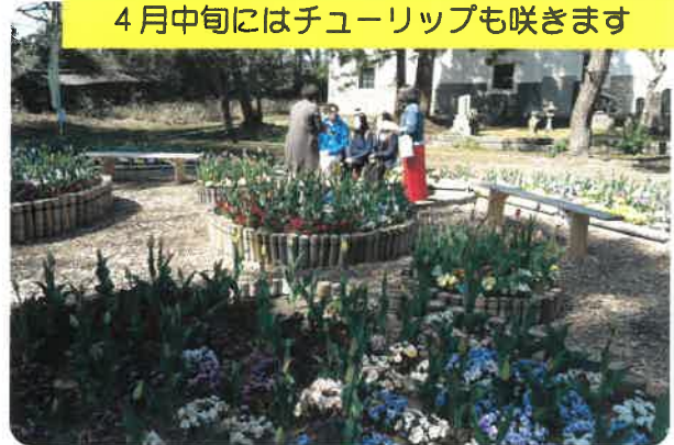
4月中旬にはチューリップも咲きます