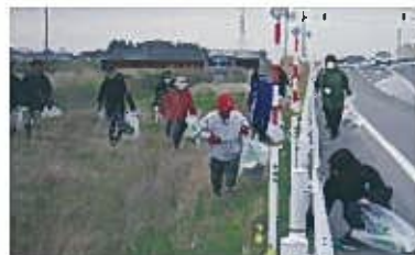
◎空き缶・ペットボトル・吸い殻・ゴミ等が多く見られます。

マラソン競技人口は年々増加傾向で、第33回目となる「白根ハーフマラソン」は1,944名申し込みで白根総合公園を発着点として開催されました。小林地区では選手の皆さんが少しでも気持ち良く走って頂ける様にと毎年クリーン作戦を行っています。当日は大勢の方より参加頂き、沿道はきれいになりました。