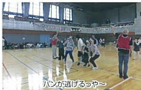
パンが逃げるっや～