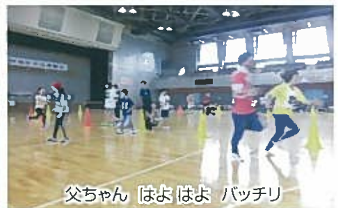
父ちゃん はよ はよ パッチリ