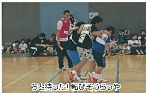
ちど待った! 転びそうらっや