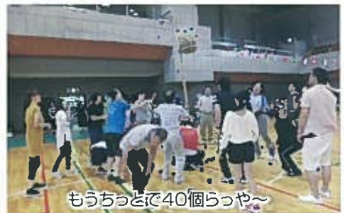
もうちょっとで40個らっや～