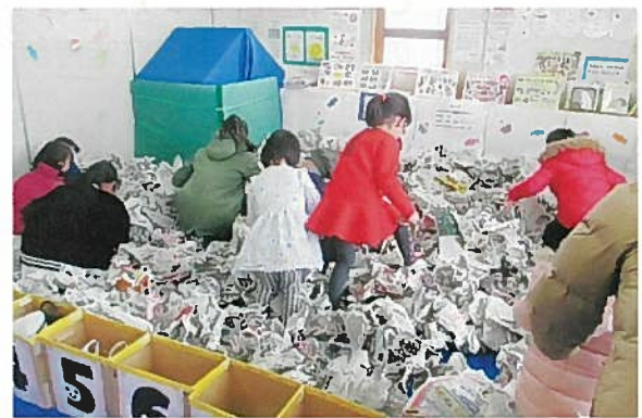
2月18日「ふゆまつり」の様子