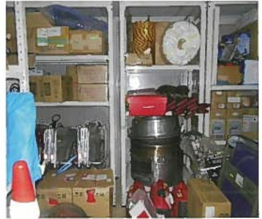
大通地域生活センター玄関右側防災倉庫内