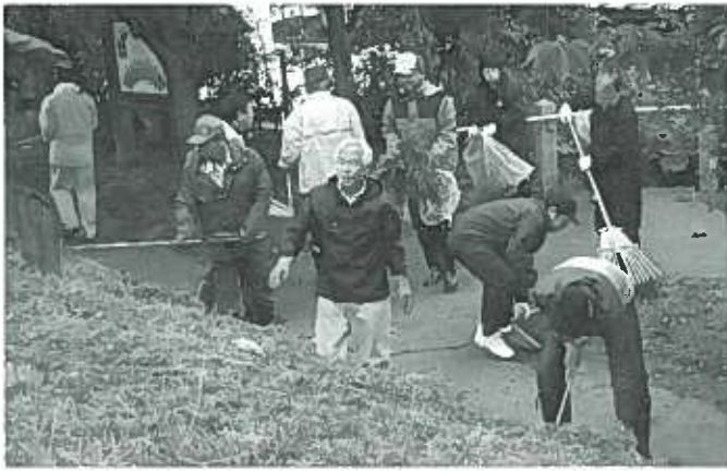
▲ ボランティアの皆さん、お疲れ様でした