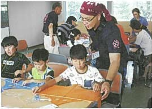
▲ 洋風づくりに挑戦中!