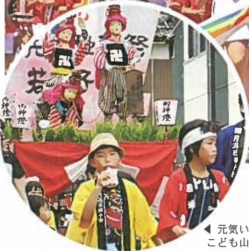
▲ 元気いっぱい こども山車行列