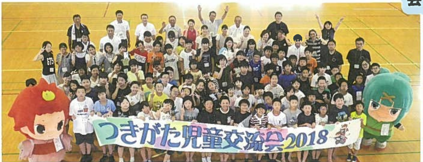
▲ つきがたっ子と笹団子郎くん、花野小町ちゃん