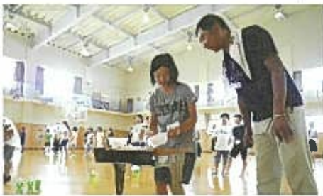
▲ 仲良くゲームで盛り上がりました

翌朝、さらに仲良くなった子どもたちは、思い出話や記念撮影をしたりしていました。そして、出発式を行い、元気に手を振って見送りをしました。この交流会での経験は、将来に繋がる貴重な思い出の残る体験になると思えました。