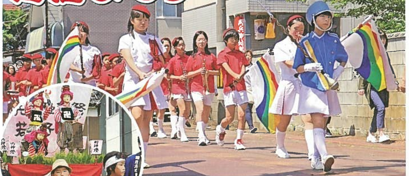
▲ 5年ぶりに行われたマーチングパレード