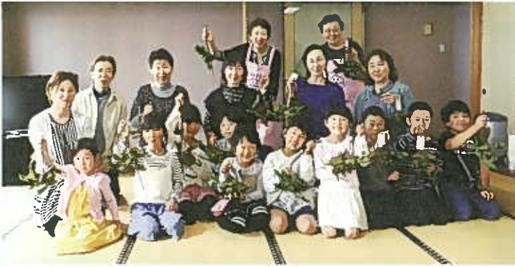
▲ 笹団子づくり「上手にできたよ!」

竹を流れるそうめんは、おいしいうえに見た目も涼しく、暑さも吹き飛びました。2日間を合わせ延べ49人が参加し、世代を超えた交流が行えました。