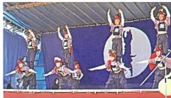
▲ 観客を魅了した角兵衛獅子の舞

月潟コミ協では恒例の北海道月形町物産販売を行いました。販売開始前から長蛇の列となり、ジギスキャンもトマトジュースも例年より多く仕入れましたが、あつという間に売り切れてしまいました。買えなかった方、大変申し訳ありませんでした。次回の大道芸フェスティバルお待ちしております。